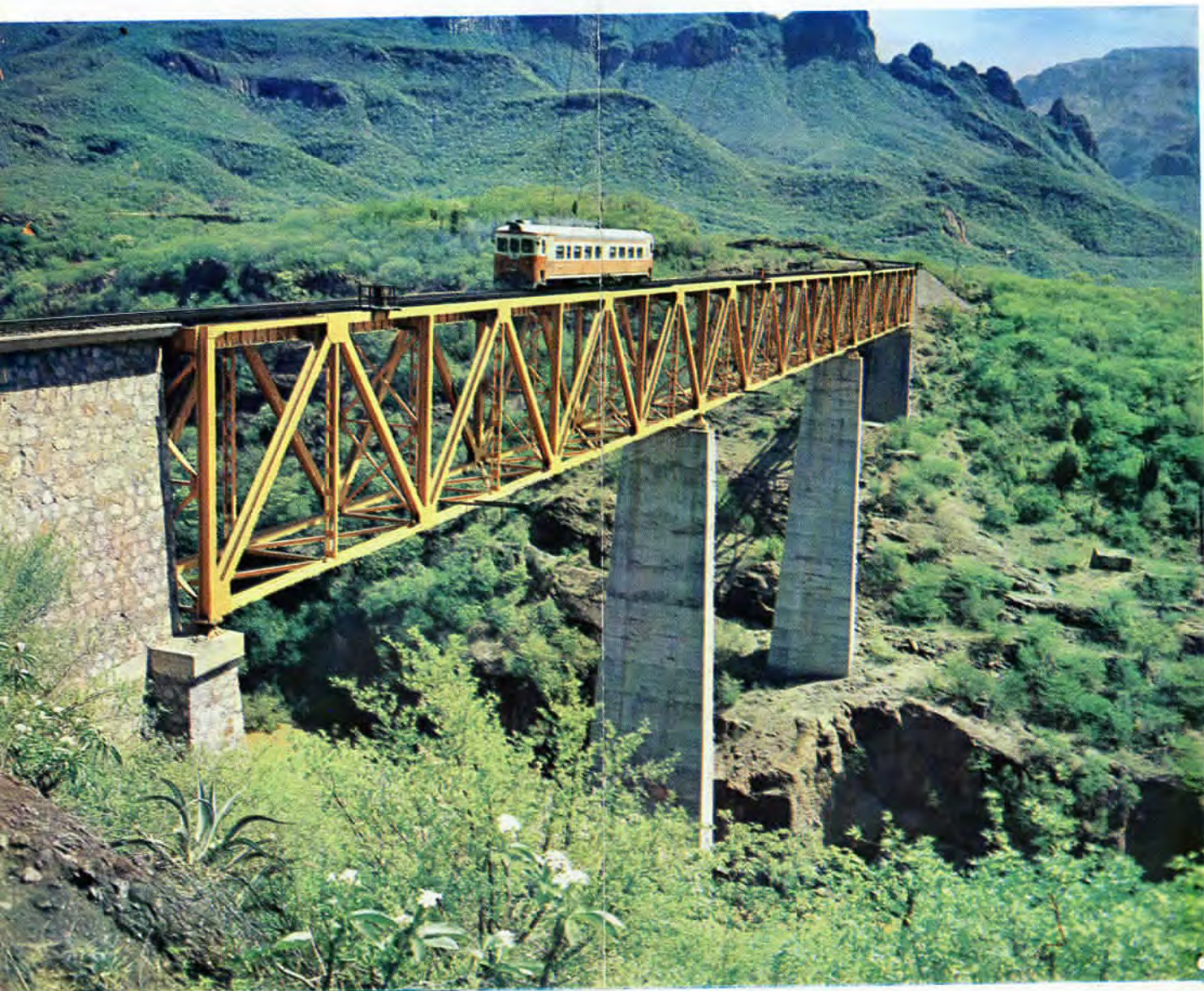
VISTA PANORAMICA "PUENTE CHINIPAS" K-748